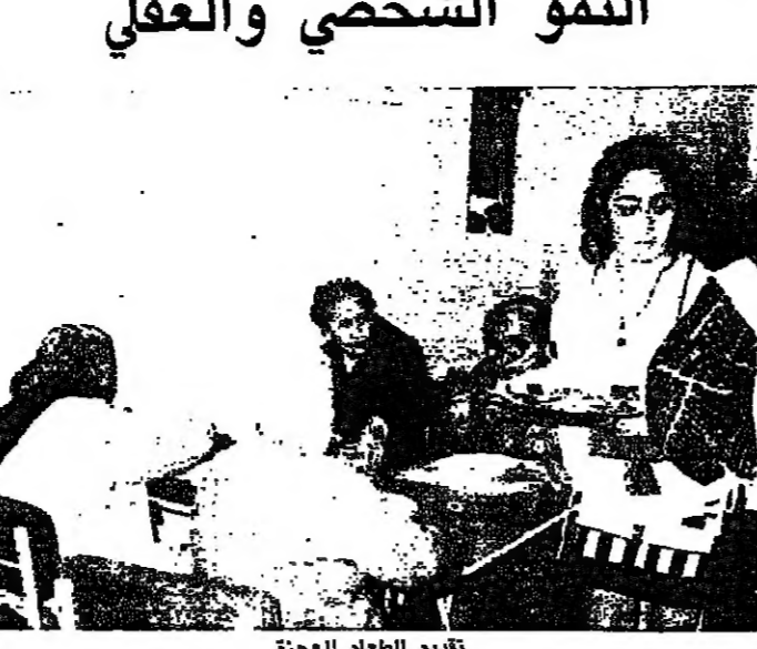
تقديم الطعام للحجرة

تصادف فرع الناشئين والشباب في الصليب الاحمر اللبناني له تاريخه ويثبت وجوده حالا في مراكز وفرع الصليب الاحمر كافة على كل المناطق اللبنانية.